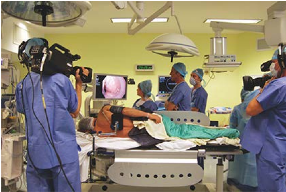
Précédente édition Video Digest