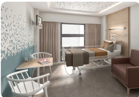
Images de synthèse non contractuelles

Le projet de rénovation des chambres vise à offrir un confort accru aux occupants dans une ambiance moderne et chaleureuse, répondant aux attentes des couples d'aujourd'hui.