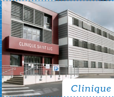
Clinique Saint Luc