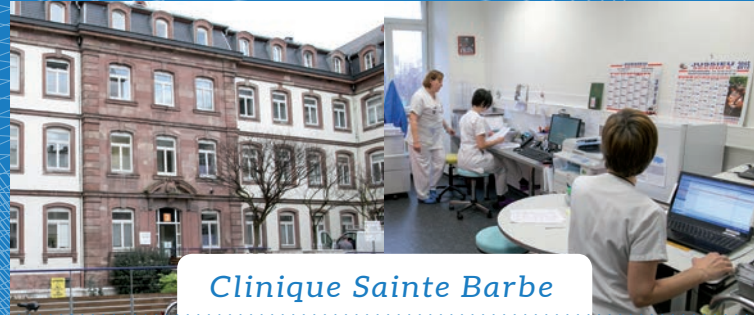
Clinique Sainte Barbe