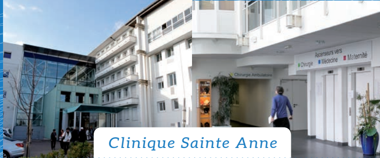
Clinique Sainte Anne